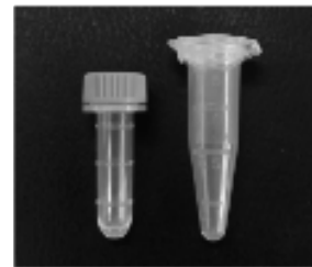
検体送付用バイアル(例)